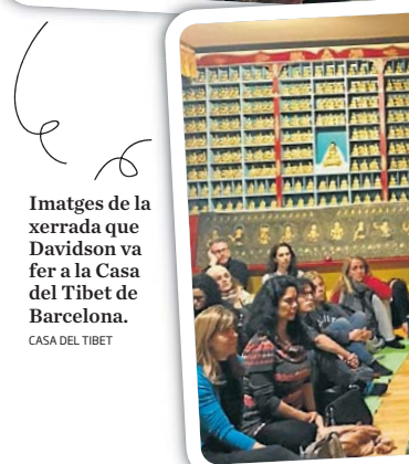
Imatges de la xerrada que Davidson va fer a la Casa del Tibet de Barcelona.